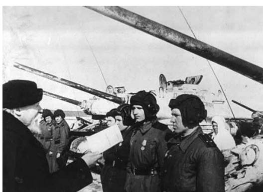
Передача колонны им. Дмитрия Донского.