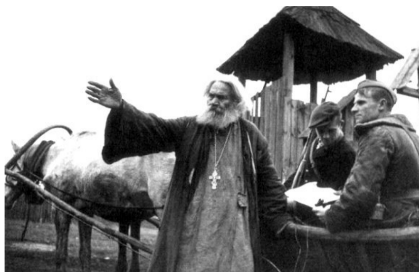
На партизанских тропах Белоруссии.