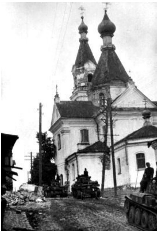
Немецкие танки проезжают мимо храма.