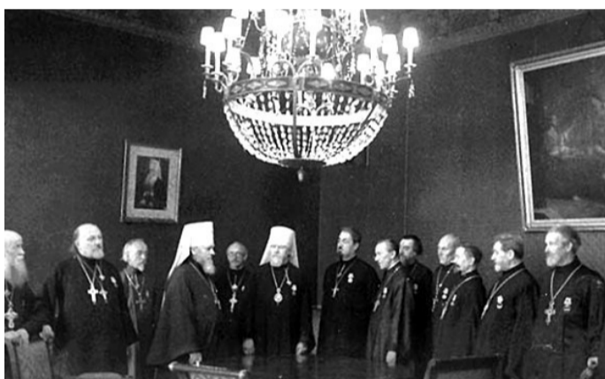
Управляющий Московской епархией митрополит Николай вручает медали "За оборону Москвы" священникам. 1944 г.