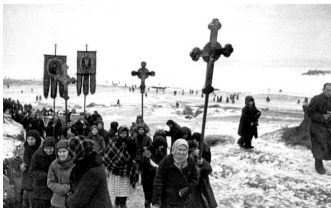
Водосвятный молебен на Днепре и крестный ход верующих села Лоцкаменка (Украина).