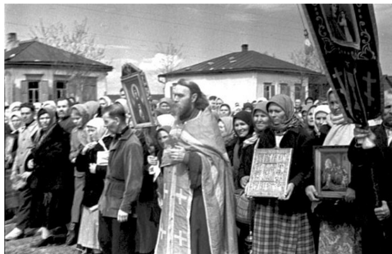
Молитвы о спасении Отечества.