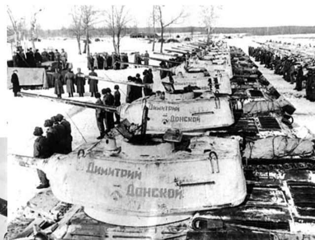
Колонна танков имени Дмитрия Донского, переданная Армии Церковью.