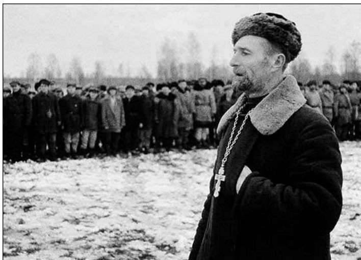
Православный священник выступает перед бойцами партизанского соединения. Ленинградская область.