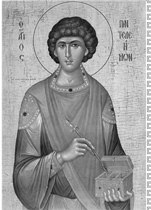
Честная глава святого великомученика и целителя Пантелеимона находится на Афоне в Русском Свято-Пантелеимоновом монастыре. http://www.sestrichestvo.ru/

имя Христо- во, дошел до гонителя христиан Максимиана. Он призвал к