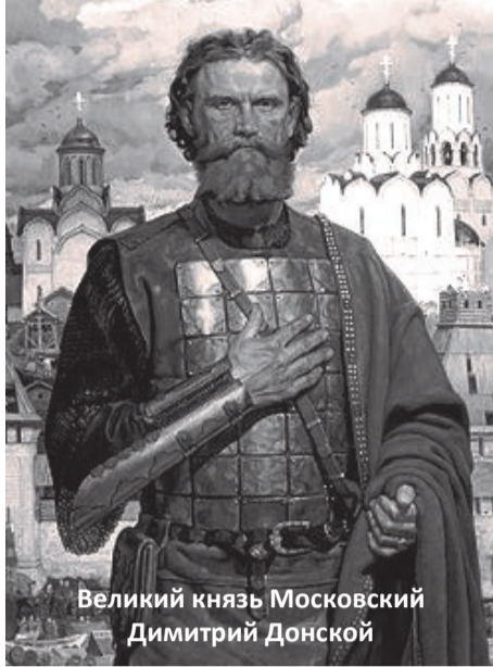
Великий князь Московский Димитрий Донской

Если нет возможности в эти дни посетить храм или кладбище, можно помолиться об упокоении почивших в домашней молитве. Вообще Церковь заповедует нам не только в особые дни поминания, но каждый день молиться об усопших родителях, сродниках, знаемых и благодетелях. Для этого в число еже-