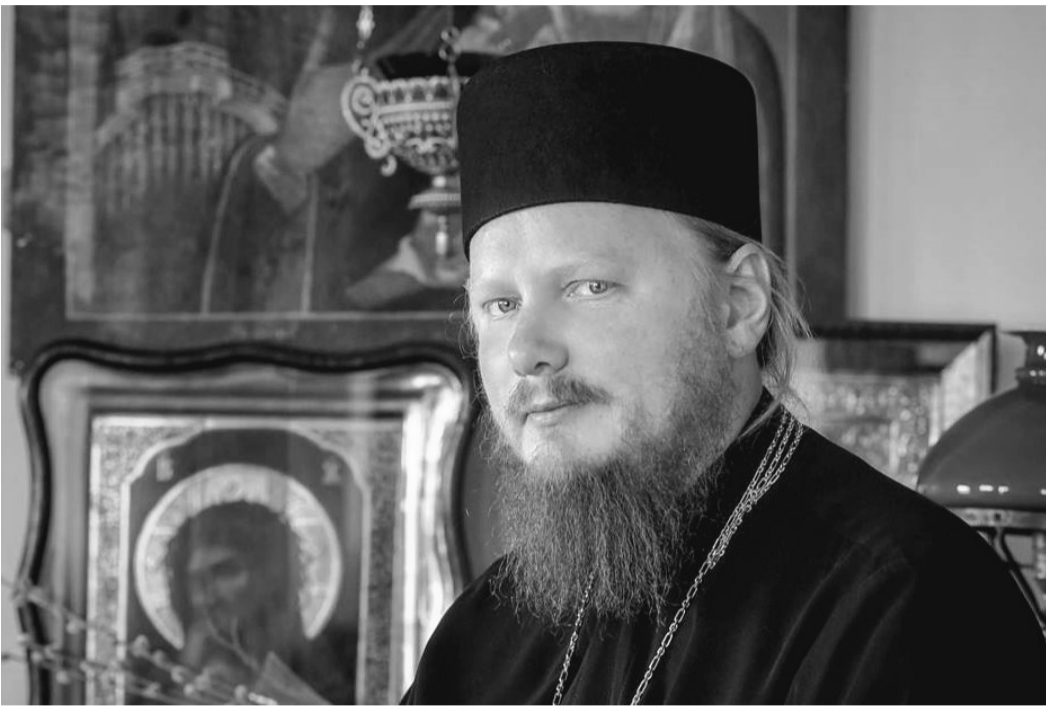
Епископ Иона (Черепанов)

Наместник Киевского Троицкого Ионинского монастыря