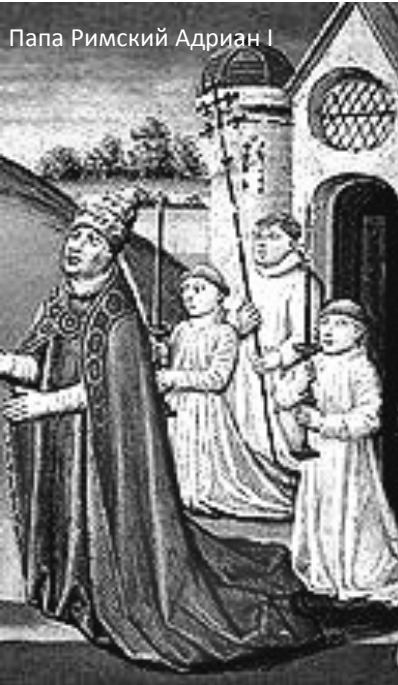
Папа Римский Адриан I

Тарасия быстро возвели во все степени священства, и 25 декабря 784 года в праздник Рождества Христова он был поставлен константинопольским патриархом, которым оставался в течение следующих 22 лет. После этого избранный патриарх по традиции разослал всем предстоятелям церковей изложение